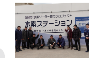
福岡市水素リーダ都市プロジェクト