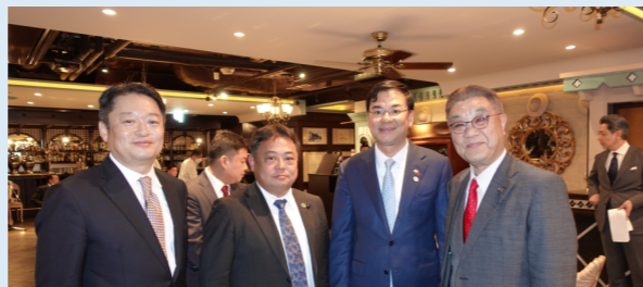
ベトナム料理とワインのマリアージュ（東京丸ビルにて）