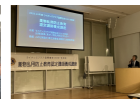
薬物乱用防止教育認定講師養成講座