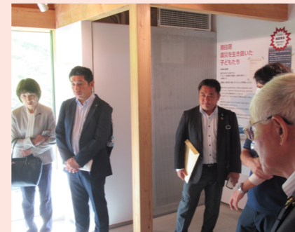
うのすまい・トモス視察