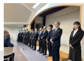
日下部警察署警察官友の会総会