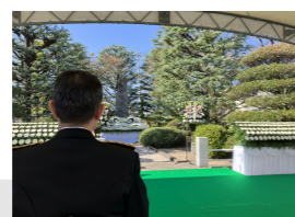
山梨県警察殉職者慰霊式典