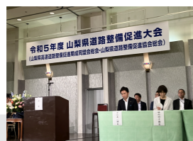
山梨県道路整備促進大会