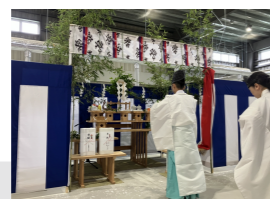
JA7ルーツ山梨塩山共選所開設式典