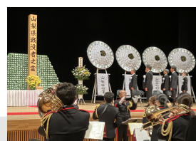
山梨県戦没者慰霊式典