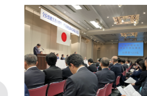
全拉致被害者の即時一括帰国を求める国民大集会