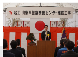
山梨県警察軌道センター建築工事・起工式