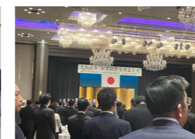
令和6年新年祝賀合同互礼会