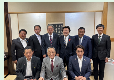
峡東3市長6県議意見交換会