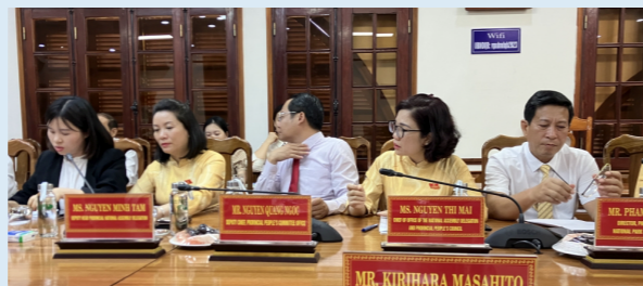
クワンビン省・人民委員会との意見交換