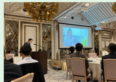
県内若手経営者の会(燦々会)研修