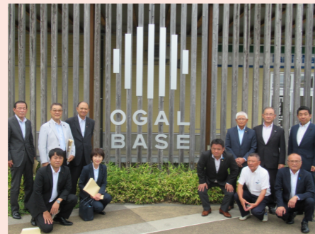
オガールプロジェクト視察